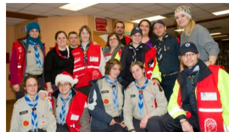
Route de district PAGE 3