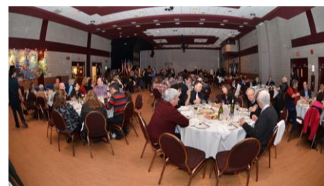
Dégustation de vins et fromages PAGE 4