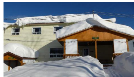
Disponibilités des bases de plein air PAGE 5