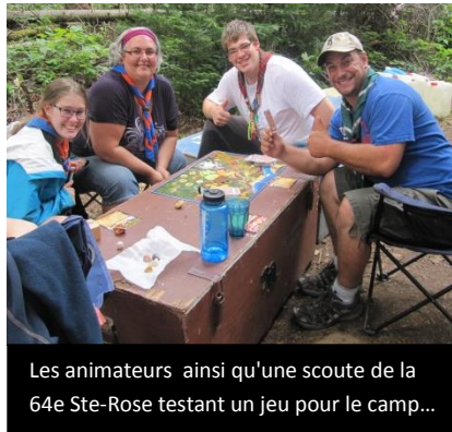
Les animateurs ainsi qu'une scoute de la 64e Ste-Rose testant un jeu pour le camp...

Cet été, nous, les scouts éclaireurs aventuriers des troupes 64e Ste- Rose, 221e de Monteuil ainsi que 71e de Laval-des-rapides, avons vécu une expérience inoubliable. Nous avons accueilli une troupe française, celle de Troyes St-Jean, avec qui nous correspondions depuis quelques temps. Ce fut toute une joie de les voir réellement pour la première fois, en pleine nature, et ce pour une semaine.